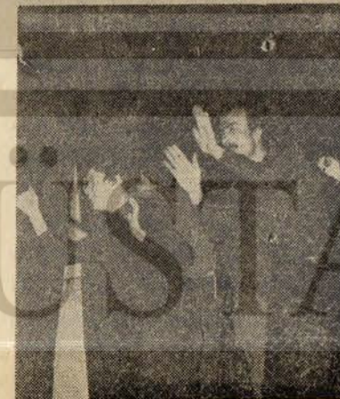
Oyunu seyreden emekçiler (Üstte) ve oyundan bir başka sahne (altta)